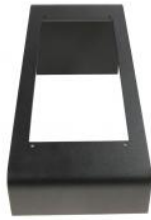
Support de bureau CRM-V