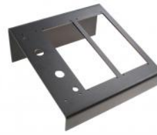
Triple support de bureau CRM-V